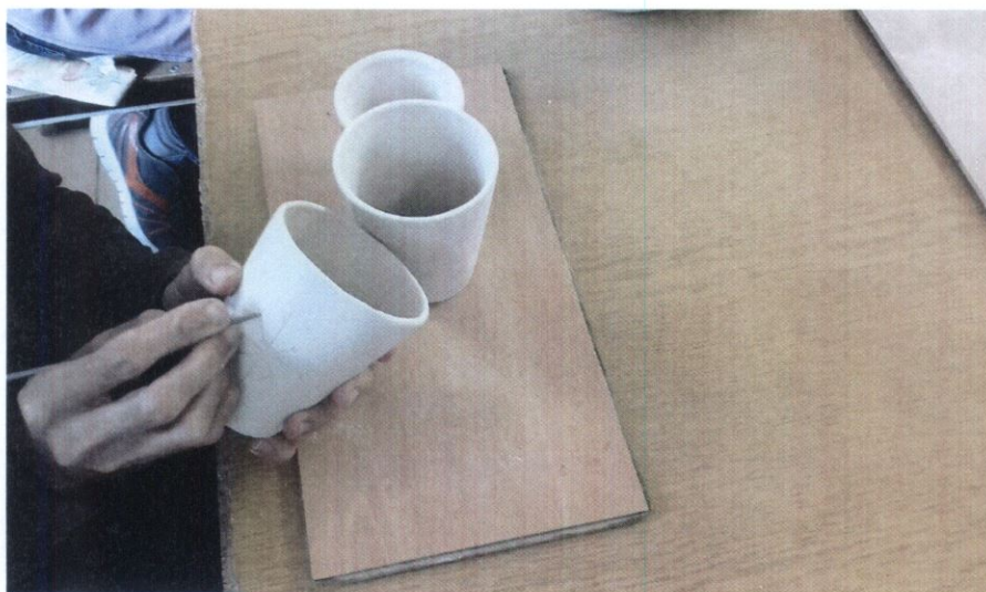
10. számú kép: Kerámiaműhely