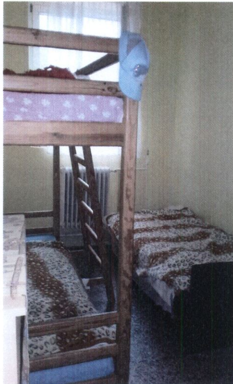
2. számú kép: Zsúfoltság kisebb szobában