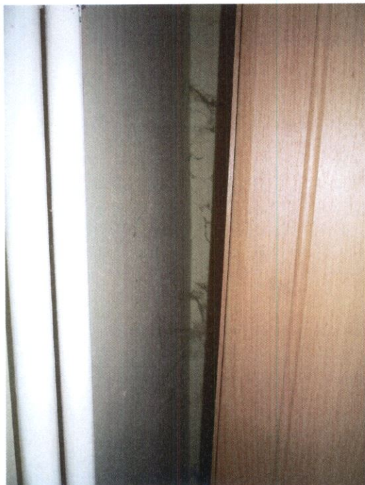
7. számú kép: Pókháló a sarokban