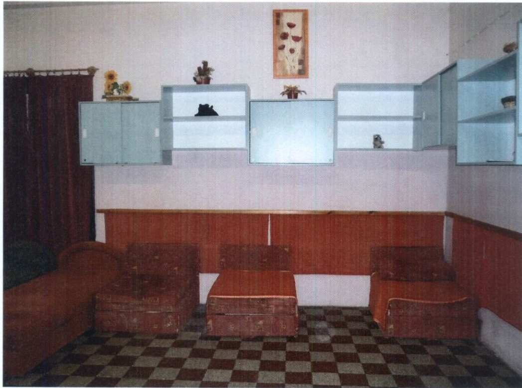
4. számú kép: Sivár polcok az ágyak környezetében