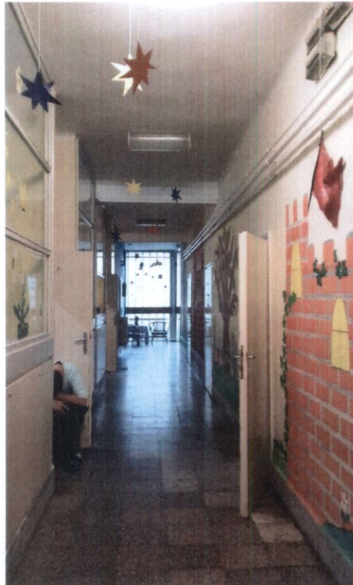
5. számú kép: Folyosón