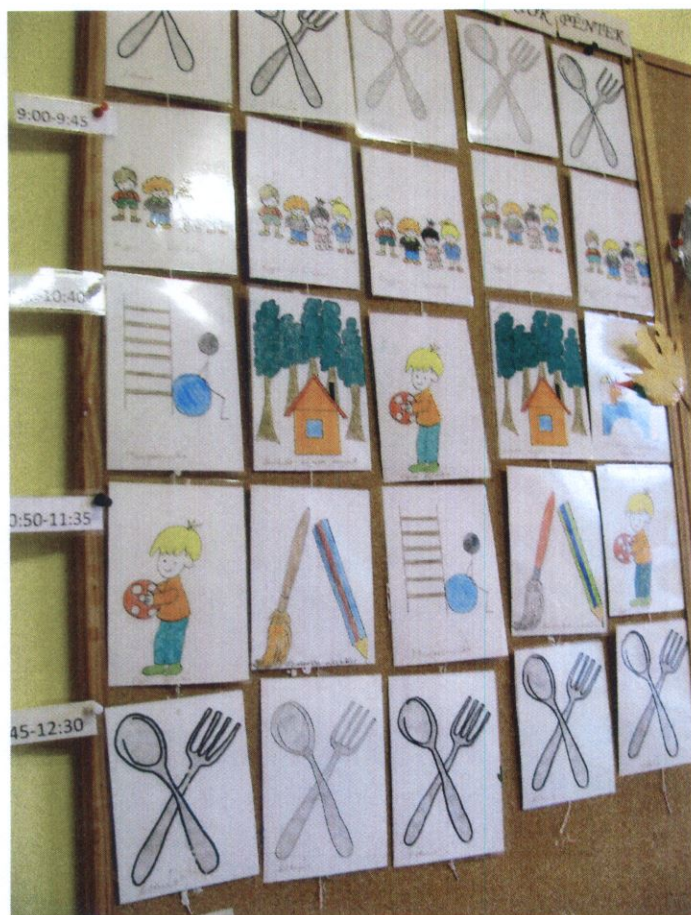
9. számú kép: Órarend