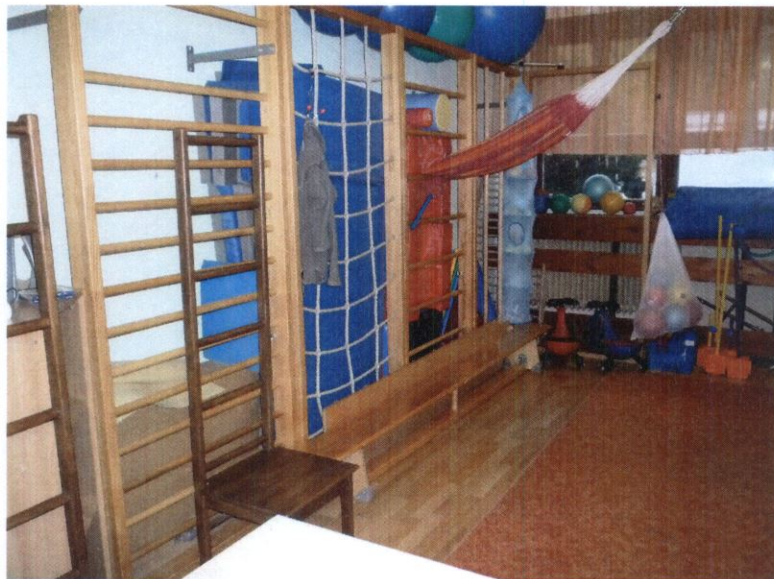
6. számú kép: Foglalkoztató helyiség