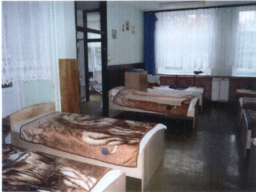
1. számú kép: Zsúfoltság nagy szobában