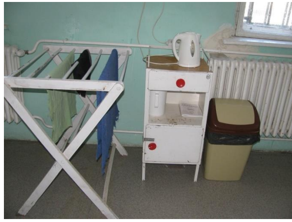
6. Kórterem az egészségügyi részlegen