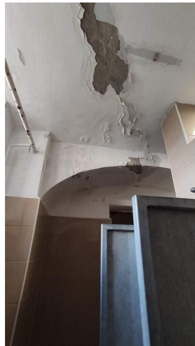
8. A fürdőhelyiség mennyezete