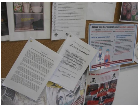
9. Faliújság, fogvatartotti tájékoztatók