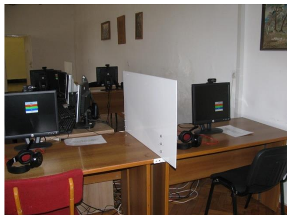
10. Skype végpontok a kultúrteremben