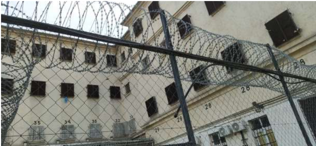
Az udvaron a kerítésre szerelt, lyuggatott fekete KPE-cső szolgált „párakapuként”