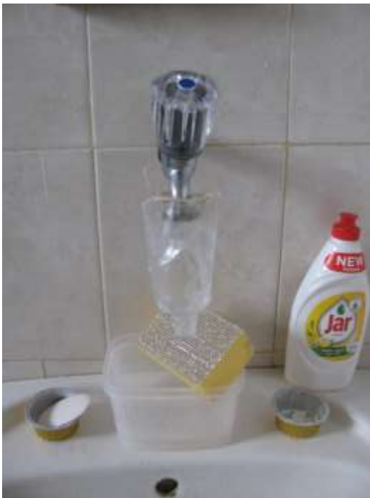
Fröcskölő csap, műanyag flakonnal orvosolva