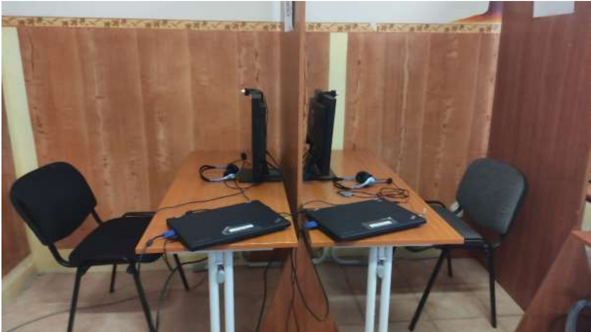
Skype-beszélő, egymástól elválasztott Skype-állomások