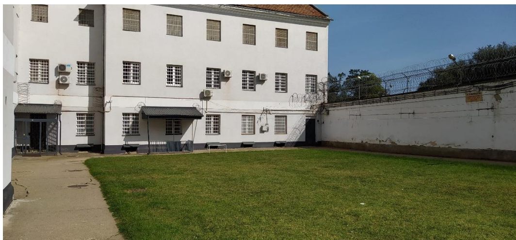
A sport- és sétaudvar