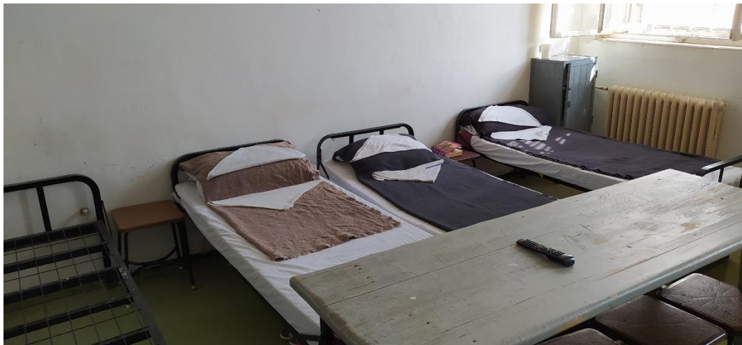
Egy zárka belseje