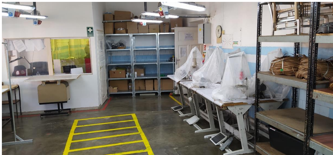
Munkáltatási részleg az Objektumban

2023. október 5-én a nemzeti megelőző mechanizmus feladatait ellátó alapvető jogok biztosa és munkatársai látogatást tettek a Szabolcs-Szatmár-Bereg Vármegyei Büntetés-végrehajtási Intézetben (a továbbiakban: Objektum).