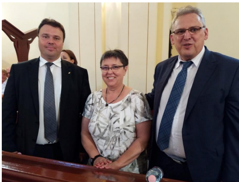
Magyarországi Szlovákok Napja – Acsa

A Magyarországi Szlovákok Napját egész napos, jó hangulatú és sokszínű kulturális programmal ünnepelte a hazai szlovák közösség a Pest megyei Acsa (Jača) községben, amelyen a biztoshelyettes és titkárságvezetője is részt vettek. Az esemény házigazdái a nap folyamán több alkalommal is felhívták a figyelmet a hazai szlovák közösség intézményeinek, infrastrukturális és anyagi működési feltételeinek jelentős fejlődésére, amelynek alapja az elmúlt évek kölcsönös bizalmon alapuló együttműködése volt. Az Országos Szlovák Önkormányzat elnöke és a szlovák kulturális, illetve érdekvédelmi szervezetek vezetői erre is tekintettel hitet tettek a közös munka folytatása mellett.