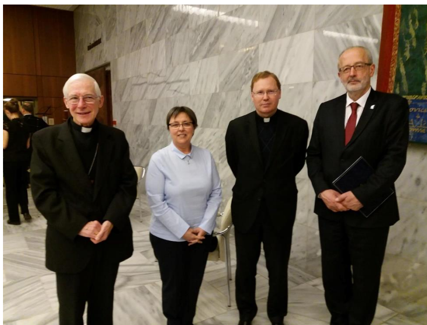
Egység és sokszínűség – az Örmény Biblia és vallásos társadalom című kiállítás megnyitója – Budapest

Március 25-én a biztoshelyettes is részt vett az Egység és sokszínűség – Örmény Biblia és vallásos társadalom című kiállítás megnyitóján. A Pázmány Péter Katolikus Egyetem Armenológiai Intézetének munkatársai és az Országos Széchényi Könyvtár kutatói által gondos munkával összeállított tárlat az első három, teljes örmény bibliakiadás mellett számos családi ereklyét, valamint az erdélyi örmények vallásgyakorlatához kötődő tárgyakat mutatott be. A biztoshelyettes az eseményt követően szakmai egyeztetést folytatott az egyetem rektorával és a Magyarországra delegált pápai nunciussal.