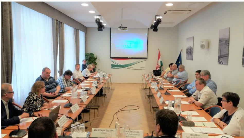
Az Igazságügyi Minisztérium Nemzetiségi Ügyekért Felelős Tematikus Munkacsoportjának ülése – Budapest

Június 20-án tartotta éves ülését az Igazságügyi Minisztérium Nemzetiségi Ügyekért Felelős Tematikus Munkacsoportja , ahol a biztoshelyettes ismertette két, a közszolgálati és a nemzetiségi média szerepével kapcsolatban kiadott elvi állásfoglalásának tartalmát, azok megállapításait, valamint megfogalmazott javaslatait. Az ülésen párbeszéd kezdődött az önkormányzati választásokkal, népszámlálással, a nemzetiségi jogi törvény módosításával és a nemzetiségi önkormányzatokat érintő stratégiai kérdésekkel kapcsolatban is.