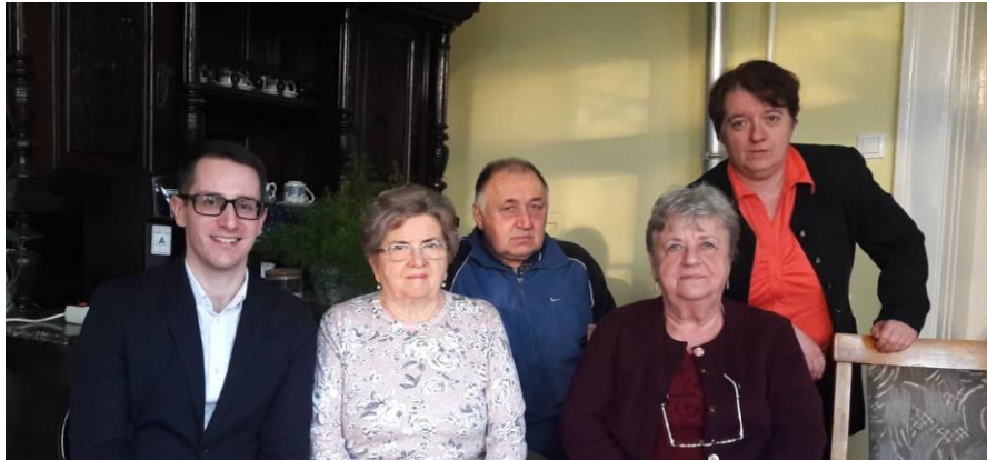
Látogatás a Német Közösségi Házban – Mezőberény

Német Hagymányápoló Egyesület vezetőivel és a szervezet több tagjával, valamint a Mezőberényi Szlovákok Szervezete elnökével.