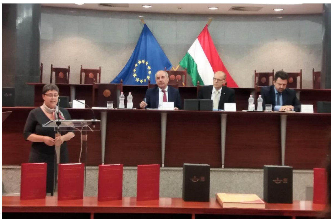
Az Alaptörvény érvényesülése a bírói gyakorlatban, könyvbemutató – Budapest

Az Alkotmánybíróság és a Kúria közös kezdeményezésére 2016-ban indult kutatómunka eredménye Az Alaptörvény érvényesülése a bírói gyakorlatban című négykötetes tudományos mű, amelyet a bemutató eseményen az Alkotmánybíróság és a Kúria elnöke mellett a biztoshelyettes is méltatott.