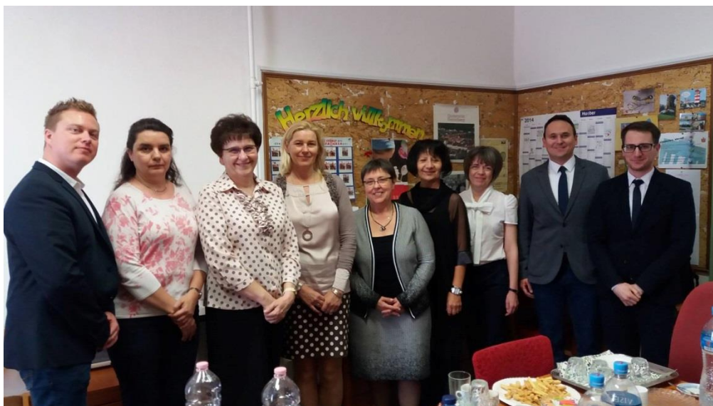
Nemzetiségi kutatás, nemzetiségi oktatás a Juhász Gyula Pedagógusképző Kar Nemzetiségi Intézetében Konferencia – Szeged

Az Alkotmánybíróság és a Kúria közös kezdeményezésére 2016-ban indult kutatómunka eredménye Az Alaptörvény érvényesülése a bírói gyakorlatban című négykötetes tudományos mű, amelyet a bemutató eseményen az Alkotmánybíróság és a Kúria elnöke mellett a biztoshelyettes is méltatott.