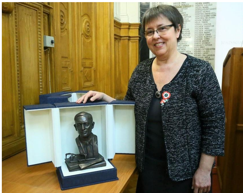
A Moór Gyula-díj átvétele a Magyar Ügyvédi Kamara székházában – Budapest

Igazságügyi Minisztérium által rendezett ünnepségen került sor a Magyar Ügyvédi Kamara székházában.