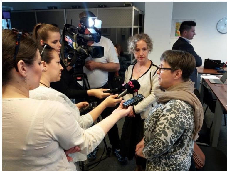
Sajtótájékoztató a V4-es ombudsmanok éves szakmai találkozója után – Pozsony

2019-ben is számos interjúfelkérés érkezett a biztoshelyetteshez, ezek jellemzően a nemzetiségi portfólió aktuális ügyeihez, így a nemzetiségi önkormányzati választásokhoz, népszámláláshoz, a nemzetiségi nevelés-oktatás helyzetéhez, a szegregáció és integráció témájához és a nemzetiségi választásokkal összefüggő kérdésekhez kapcsolódtak.