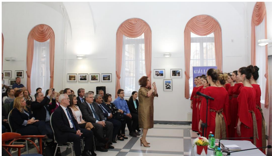
Az Országos Nemzetiségi Rajzverseny és Nemzetiségi Népismeret Verseny díjkiosztó ünnepsége az Alapvető Jogok Biztosának Hivatalában

2019-ben már második alkalommal adott otthont a Hivatal az Országos Nemzetiségi Rajzverseny és Nemzetiségi Népismeret Verseny, valamint Országos Nemzetiségi Fotópályázat díjátadó ünnepségének , amelyet a biztoshelyettes nyitott meg. Az Oktatási Hivatal Nemzetiségi Pedagógiai Központja (Nemzetiségi POK) által meghirdetett versenyen nemzetiségi óvodások és iskolások nevezhettek be a nemzetiségi léthez, mindennapokhoz kötődő témájú grafikai- vagy fotóművészeti alkotásokkal, amelyeket nemzetiségi képzőművészekből álló zsűri értékelt.