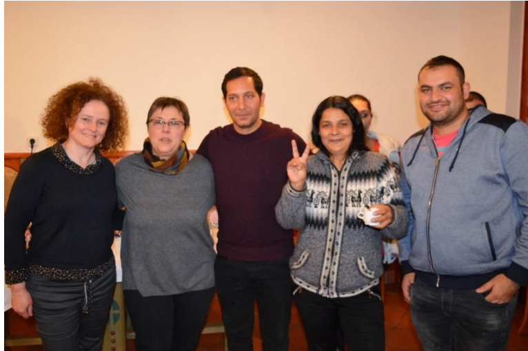
Emberi jogi képzés az Országos Református Cigánymisszió munkatársai számára – Berekfürdő