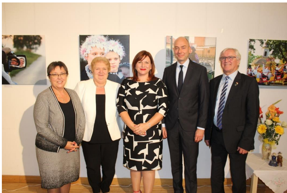
A Magyarországi Német Kulturális és Információs Központ 15. éves jubileumi ünnepe – Budapest