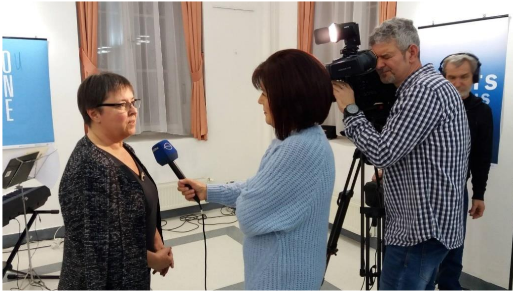
Interjú az Unser Bildschirm magazin számára – Budapest

A hazai nemzetiségi sajtó 2019-ben is rendszeresen foglalkozott a biztoshelyettes tevékenységével, különösen az adott közösséget érintő ügyek és a biztoshelyettes által szervezett rendezvények, illetve szakmai események kapcsán. Ebben a munkában kiemelkedő médiapartner volt az alapításának 25. évfordulóját ünneplő Barátság folyóirat és a 40 éves Unser Bildschirm magazin. Pozitív tapasztalat, hogy a hazai fórumokon megjelenő híreket gyakran az anyaországi médiumok is átveszik, így a biztoshelyettes tevékenysége nemzetközi nyilvánosságot is kap.