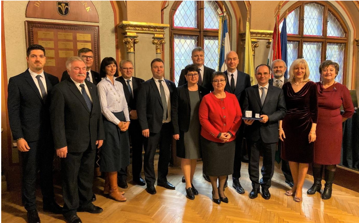
Justitia Regnorum Fundamentum-díj átadó ünnepsége – Budapest

Az év utolsó rendezvényeként a Hivatal december 9-én rendezte meg a 2019-es Justitia Regnorum Fundamentum-díjak átadó ünnepségét , amelyen az elismerést idén az Országos Nemzetiségi Önkormányzatok Szövetsége Egyesület kapta. A díj elismerése annak a fáradhatatlan munkának, amelyet a szervezet immár tíz éve folytat a magyarországi nemzetiségek jogainak magas szintű érvényesítése érdekében. A Szövetség tevékenysége nagyban elősegítette és elősegíti az Alaptörvényben, a nemzetiségek jogairól szóló sarkalatos törvényben, valamint a kapcsolódó jogszabályokban a nemzetiségek intézményei és tagjai számára garantált jogok, érdekérvényesítési lehetőségek optimális kihasználását.