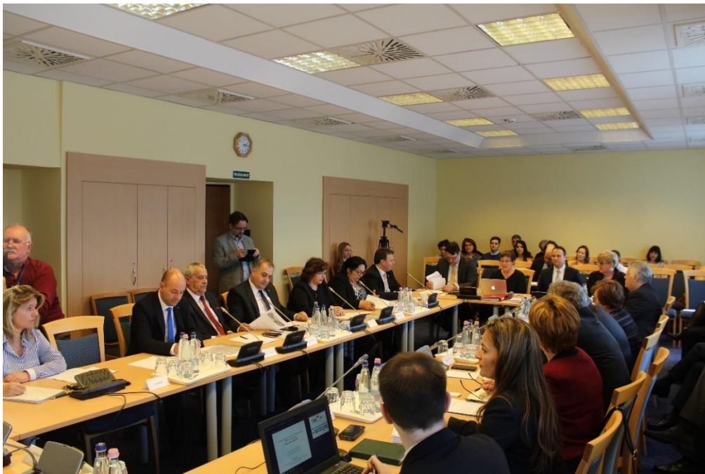
Biztoshelyettesi beszámoló az Országgyűlés Magyarországi nemzetiségek bizottságának ülésén – Budapest

Március 12-én az Országgyűlés Magyarországi nemzetiségek bizottsága ülésén megtárgyalta és egyhangúlag elfogadta a nemzetiségi biztoshelyettes 2017-es beszámolóját , valamint több, 2018-ban született elvi állásfoglalását és ombudsmannal közös jelentését is. A közel négy órás tájékoztatót követően a bizottság elnöke a testület nevében megköszönte a biztoshelyettes magas szakmai színvonalú munkáját, valamint reményét fejezte ki, hogy 2019 októberétől ismételten lehetőséget kap a megkezdett közös munka folytatására, ennek érdekében pedig a bizottság támogatásáról biztosította őt.