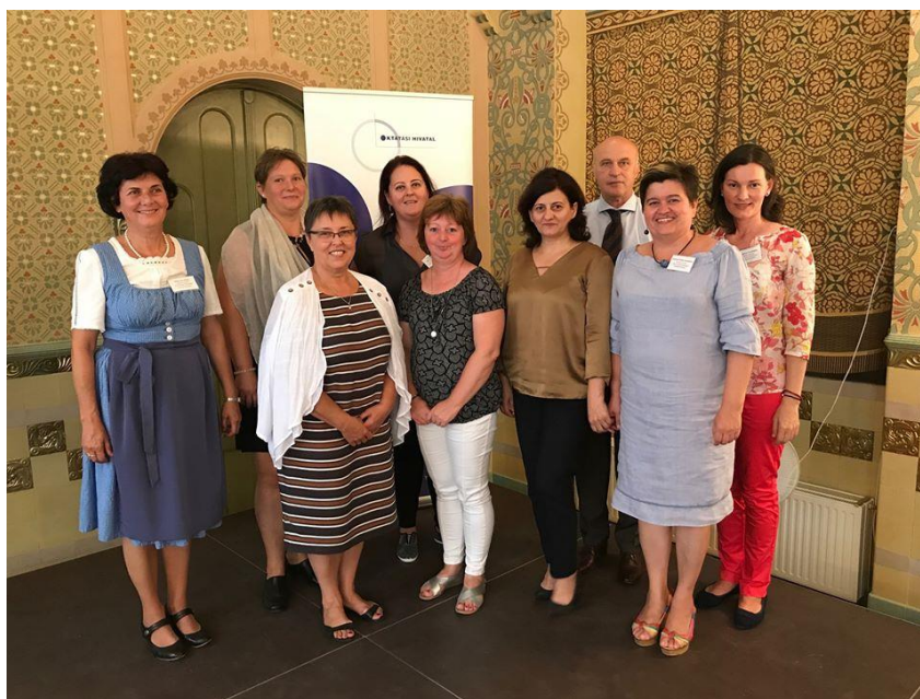
Nemzetiségi szakmai tanévnyitó konferencia - Budapest

Szeptember 1-jén a Nemzetiségi POK szervezésében az EMMI, az Oktatási Hivatal és a Klebelsberg Központ közös szakmai tanévnyitó konferenciát tartott a nemzetiség nevelési-oktatási intézmények fenntartói, vezetői és munkatársai számára. Az esemény résztvevői megismerhették a 2019/2020. évi jelentősebb oktatáspolitikai és pedagógiai módszertani változásokat, valamint információt kaphattak az intézményeket érintő alapvető pénzügyi és infrastrukturális helyzet következő évben várható alakulásáról.