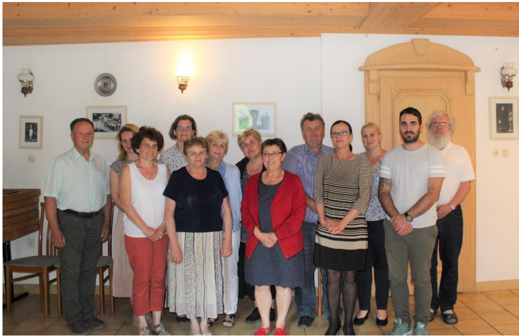
Hebyszíni látogatás – Mány

Június 20-án tartotta éves ülését az Igazságügyi Minisztérium Nemzetiségi Ügyekért Felelős Tematikus Munkacsoportja , ahol a biztoshelyettes ismertette két, a közszolgálati és a nemzetiségi média szerepével kapcsolatban kiadott elvi állásfoglalásának tartalmát, azok megállapításait, valamint megfogalmazott javaslatait. Az ülésen párbeszéd kezdődött az önkormányzati választásokkal, népszámlálással, a nemzetiségi jogi törvény módosításával és a nemzetiségi önkormányzatokat érintő stratégiai kérdésekkel kapcsolatban is.