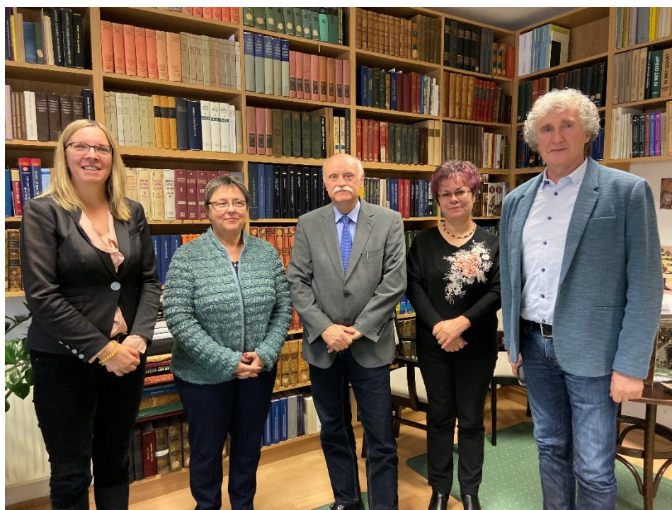
Roma életképek az 1950-es évekből – könyvbemutató a Szabolcs-Szatmár-Bereg Megyei Levéltárban, Nyíregyháza