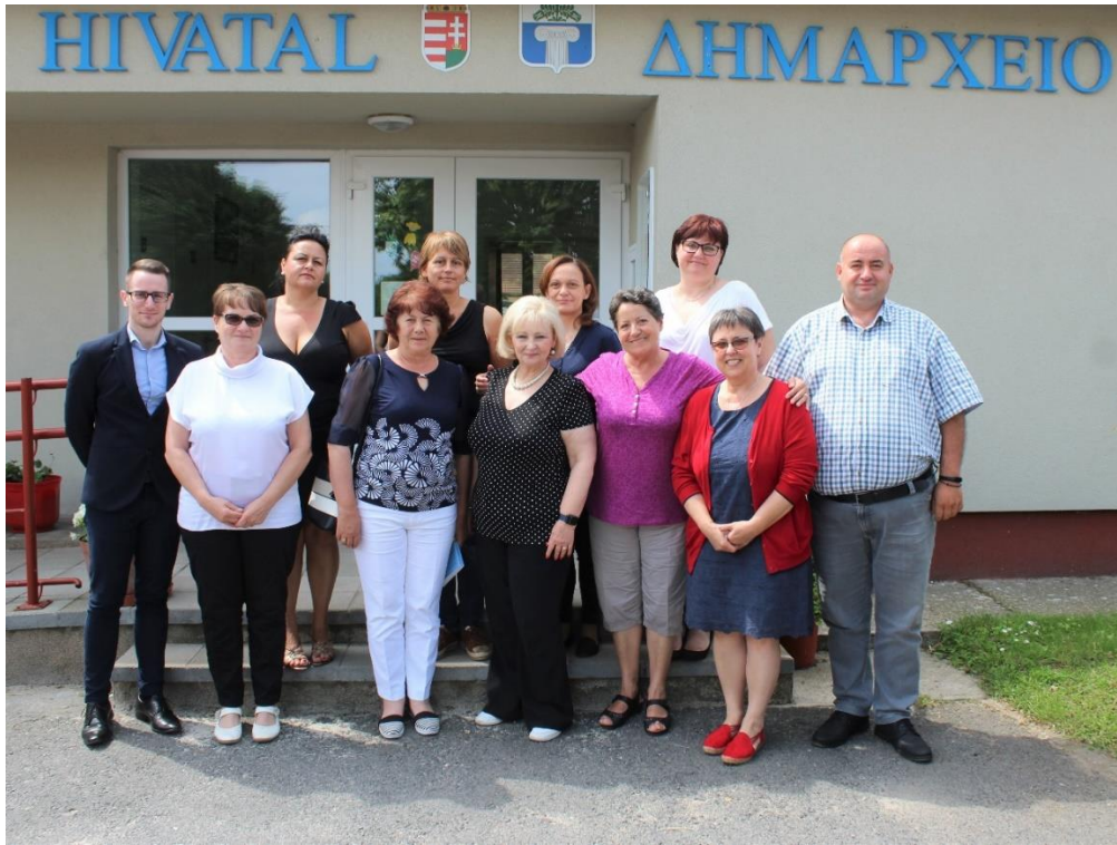
Helyszíni látogatás – Beloianisz

civil szervezetek vezetői és tagjai fogadták. A jó hangulatú és szakmailag is előremutató megbeszélésen a biztoshelyettes megismerkedhetett a görög nemzetiségi önkormányzat, a helyi oktatási intézmények és civil szervezetek sokrétű és elismerésre méltó tevékenységével, a település görög nemzetiségi lakosságát érintő aktuális kérdésekkel.